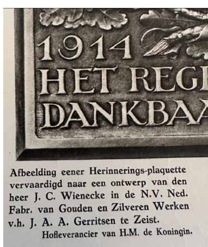
Afbeelding eener Herinnerings-plaquette vervaardigd naar een ontwerp van den heer J. C. Wienecke in de N.V. Ned. Fabr. van Gouden en Zilveren Werken v.h. J. A. A. Gerritsen te Zeist. Hofleverancier van H.M. de Koningin.