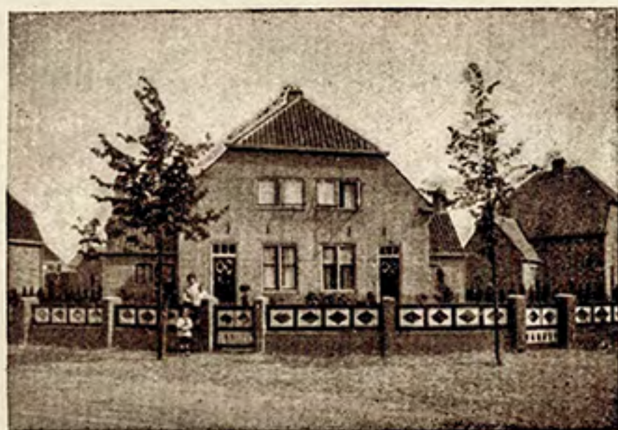
Een woningtype aan den Bergweg.