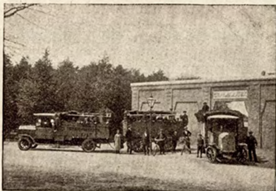
Het vertrek der Vrachtauto's waarmede een gedeelte van het personeel naar omliggende plaatsen vervoerd wordt.