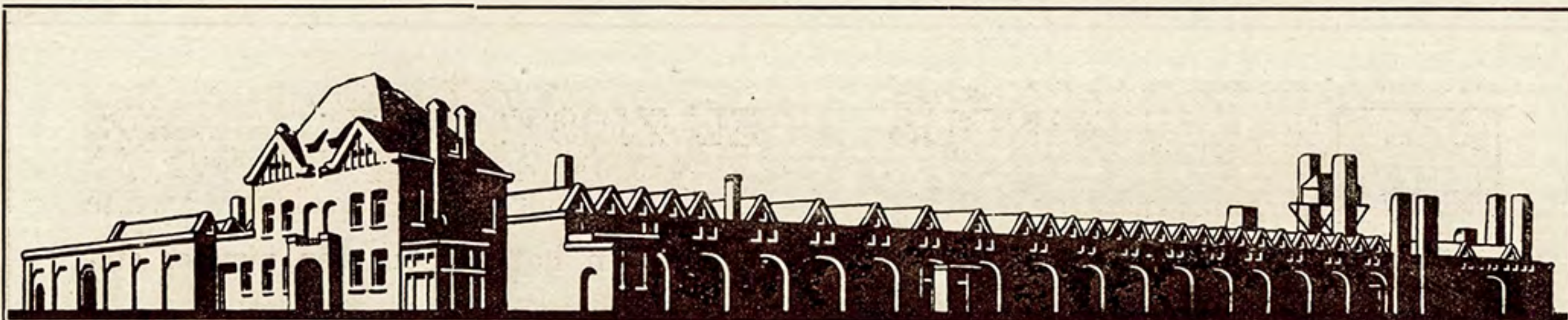
Silhouet van de Gerofabriek te Zeist.