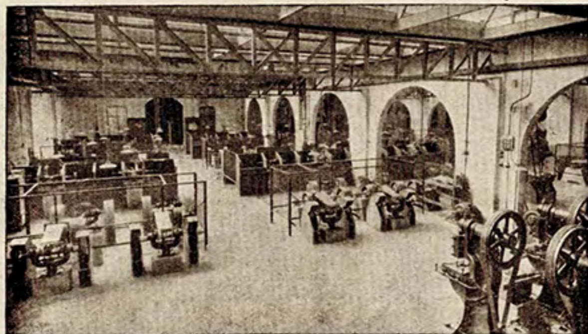
Een der drie afdeelingen der Slijperij met haar 120 slijpmachines.

terwijl zelfs een moderne fabriek, de GEROFABRIEK, voor een gedeelte van haar personeel een auto-vervoer naar omliggende, eenigszins afgelegen plaatsen heeft ingericht. Informeert men dan eens bij een Zeistenaar, dan zal hij heel wat weten te vertellen van dit bedrijf, dat in 1910 op kleine schaal werd opgericht op een punt, waar men toen nog niet dacht eens, dank zij den gestadigen groei, een complex fabrieksgebouwen te zullen zien verrijzen, waarvan het eigenaardige silhouet nu een ieder opvalt, die Zeist nadert van den kant van Huis ter Heide. Daar aan den Bergweg worden in de ruime fabriekshallen het ruwe koper, nikkel en zink omgesmolten tot het zuiver wit metaalalliage, dat uitgewalst tot platen de grondstof vormt voor