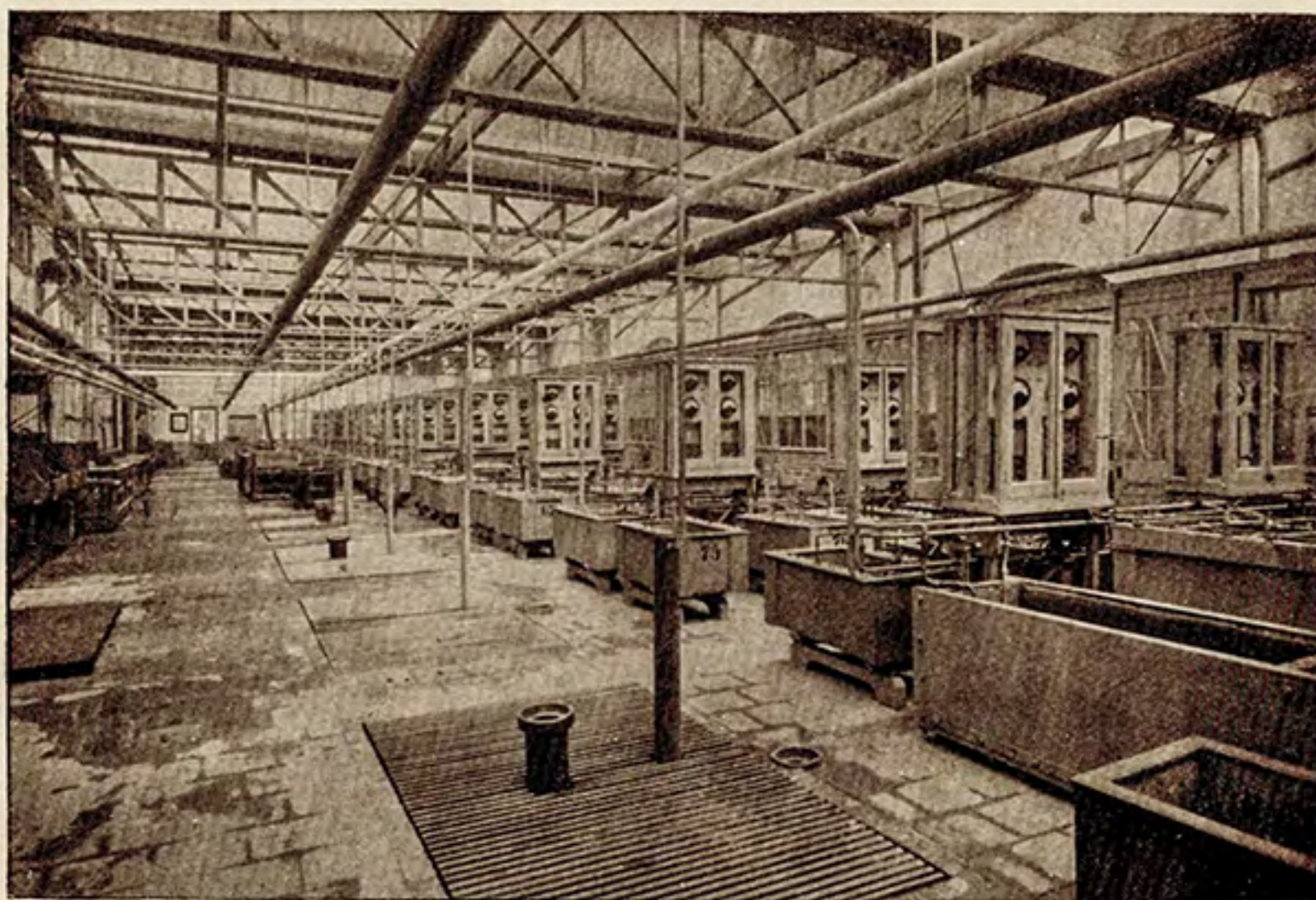
De galvaniseerinrichting, waar in de 103 zilverbaden met een inhoud van ca. 15000 Liter het Gero-Alpacca met een laag zuiver zilver wordt gedekt, waardoor het Gero-Zilver ontstaat.

de lepels en vorken en andere couvertartikelen, die deze fabriek in groote verscheidenheid vervaardigt en die als GERO ALPACCA of, gedekt met een laag zuiver zilver, als GERO-ZILVER in het geheele land verkrijgbaar zijn. Fabrikaten, die dank zij hun goede kwaliteit, hun modellen en verpakking zich een wereldnaam hebben verworven en den naam van Zeist, ook als industrie-plaats eer aan doen.