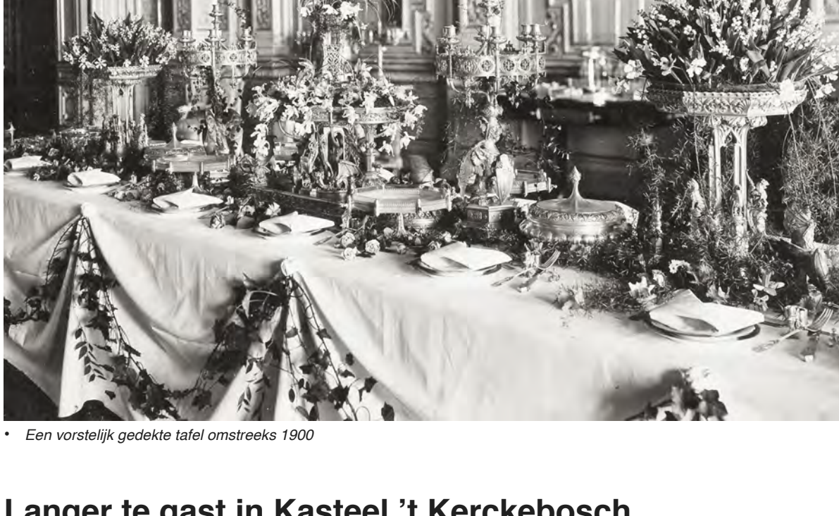
• Een vorstelijk gedekte tafel omstreeks 1900

Ook begrijpt zij maar al te goed dat een fraai met zilveren bestek en serviesgoed gedekte tafel met zilver veel poetsen betekent. Echter met de volgende link krijgt u een overzicht betreffende het snel en kundig poetsen van zilverwerk. Op de foto hieronder ziet u dat het altijd erger kan. Naar het zilver poetsen: www.zilverkamerzeist.nl/zilver.html